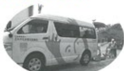
福祉有償運送サービス

本年度も、地域のみなさまのご協力により多くの善意募金が寄せられました。みなさまから寄せられた善意募金により「福祉有償運送サービス事業」「福祉機器貸出事業」等、市民の参画により実施する福祉サービス活動や事業、ボランティア・市民活動の基盤整備として「誰もが安心して暮らすことができる地域づくり」を目指して事業を進めています。ご協力いただきまことにありがとうございました。