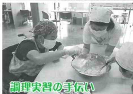
調理実習の手伝い