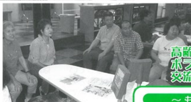
高齢者大学 ボランティアとの 交流会(ポーリング大会)

三木市立障害者総合支援センターはばたきの丘では、平成21年の開設当初より、地域に開かれた施設をめざし、地域交流活動を推進してきました。今では、はばたき祭りや文化教室などの催し物の開催や様々なボランティア参加、地域の行事への参加など地域の交流拠点として根付いてきています。