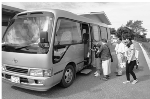
▲マイクロバス(28人乗り)

地域での住民が主体となった福祉活動（自治会主催の行事など）で活用されている地域活動車の維持管理（ガソリン代や車検代等の整備費用）に共同募金が使われています。